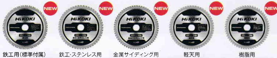
鉄工用(標準付属) 鉄工・ステンレス用 金属サイディング用 軽天用 樹脂用