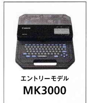
エントリーモデル MK3000